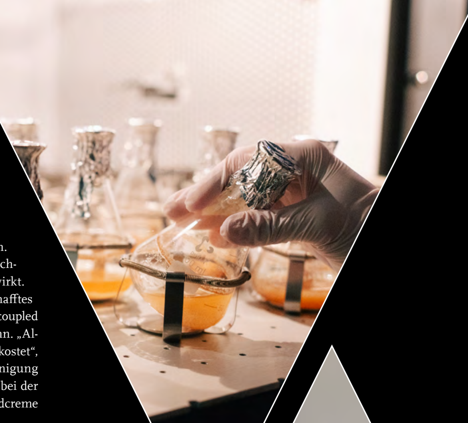
Kultivierung von Streptomyces chartreusis NRRL 3882 in Flüssigkultur zur Produktion von Calcimycin