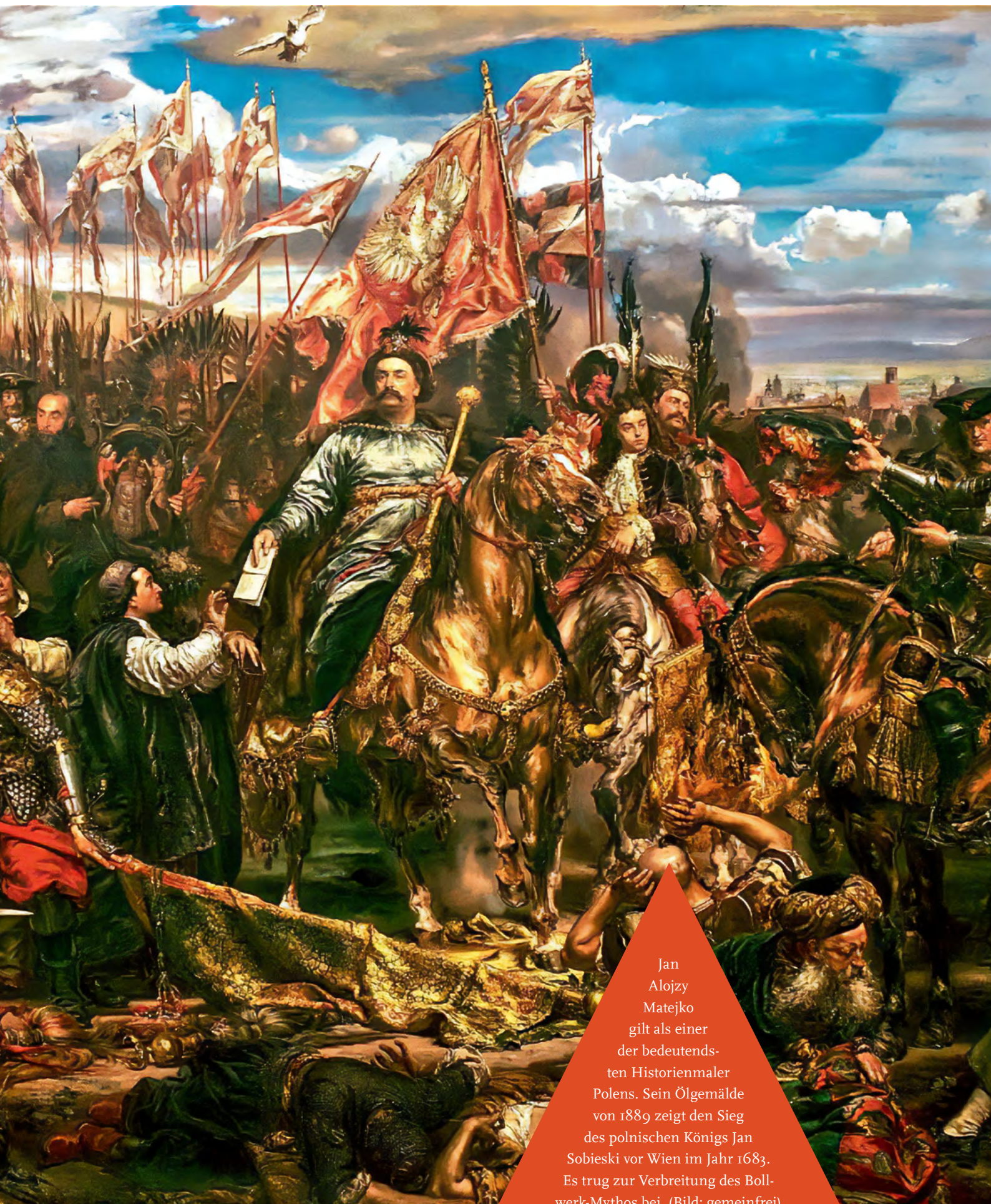
Jan Alojzy Matejko gilt als einer der bedeutends- ten Historienmaler Polens. Sein Ölgemälde von 1889 zeigt den Sieg des polnischen Königs Jan Sobieski vor Wien im Jahr 1683. Es trug zur Verbreitung des Boll- werk-Mythos bei.