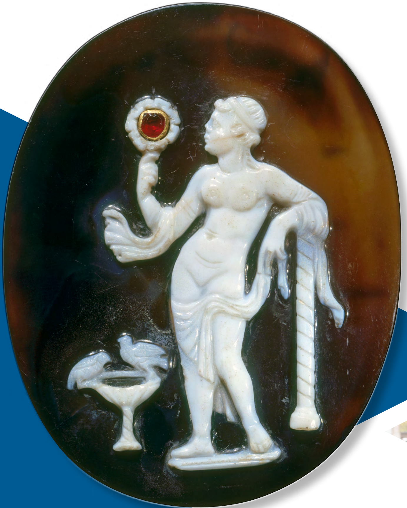
Diese antike Gemme aus dem ersten Jahrhundert nach Christus war im Mittelalter Teil eines Arm-Reliquiars des Heiligen Nikolaus.