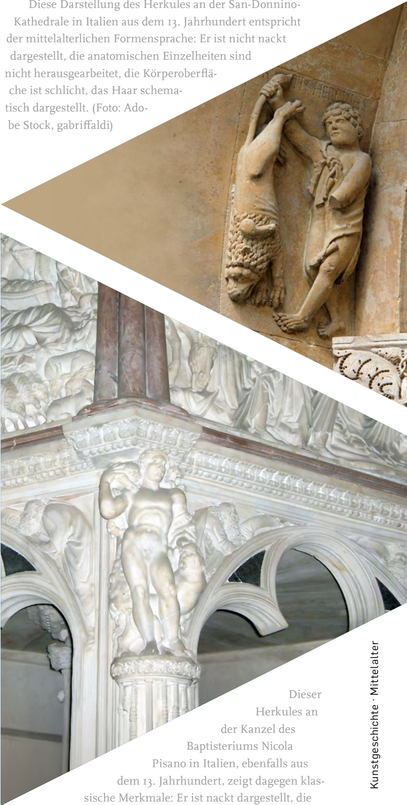
Dieser Herkules an der Kanzel des Baptisteriums Nicola Pisano in Italien, ebenfalls aus dem 13. Jahrhundert, zeigt dagegen klassische Merkmale: Er ist nackt dargestellt, die Körperoberfläche sehr detailliert und naturorientiert, ebenso wie das Haar.

auch in der italienischen Renaissance. Er sieht sich selbst als einen Klassizisten undercover.